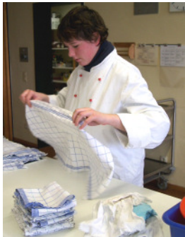
Berufskleidung ist aus hygienischen Gründen im Unterricht unerlässlich.

Hauswirtschaft er/in ist ein vielseitiger Beruf. Auszubildende sollten interessiert sein an