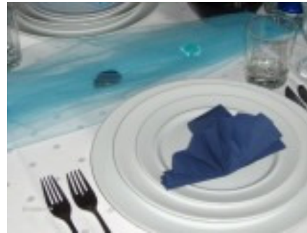
Tischdekorationen sind dem Thema angepasst.