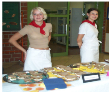
Einheitliche Kleidung gehört zur Präsentation der Produkte und zum Service