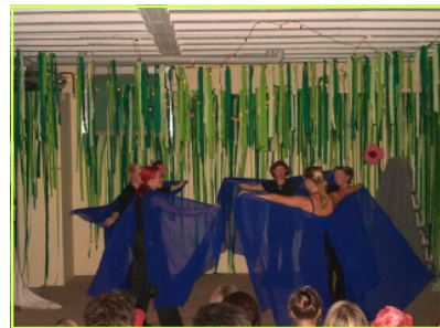
Darstellendes Spiel - Rhythmik