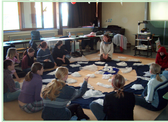
Bilderbuchbetrachtung: „Der kleine Eisbär“